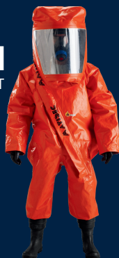
DM II Type 1-ET