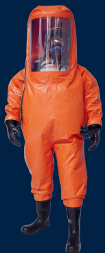
ULM II Type 1-ET

Scaphandre chimique EN 943-1 et EN 943-2