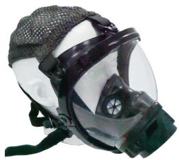
TOTAL III MASK